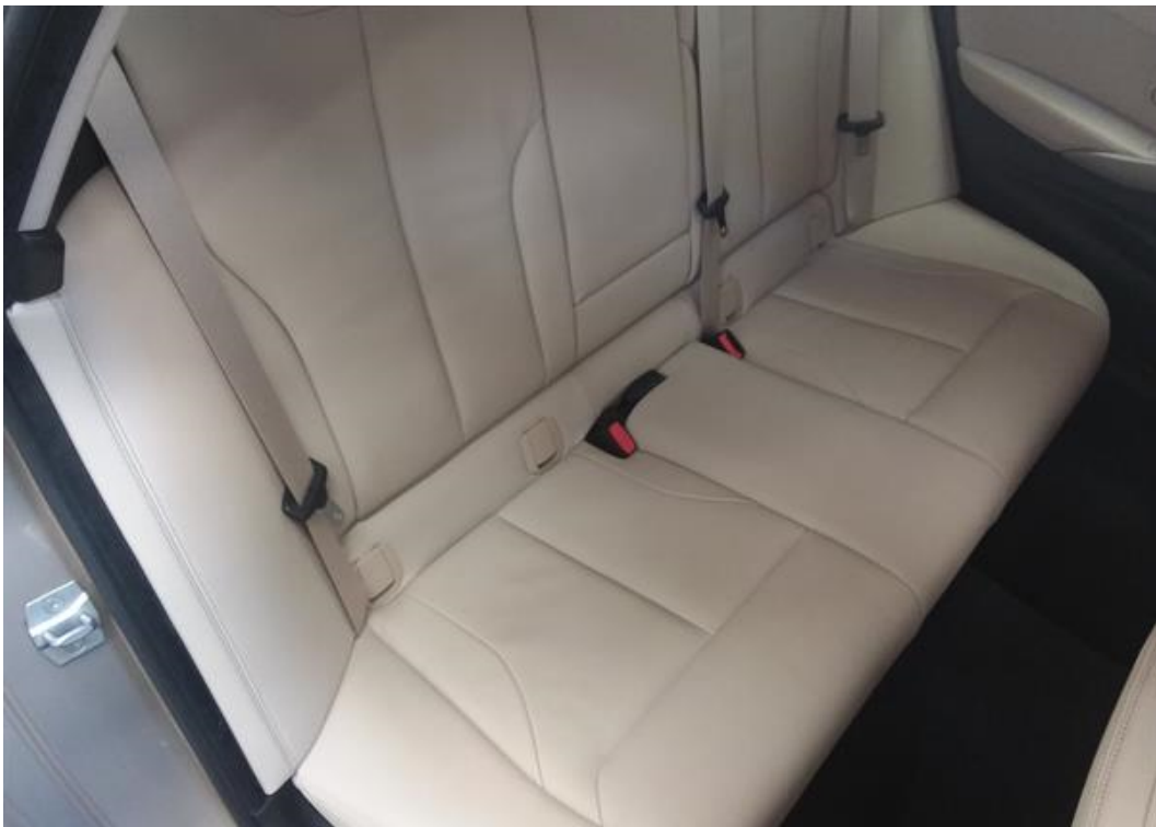
Zadní pravé sedadlo