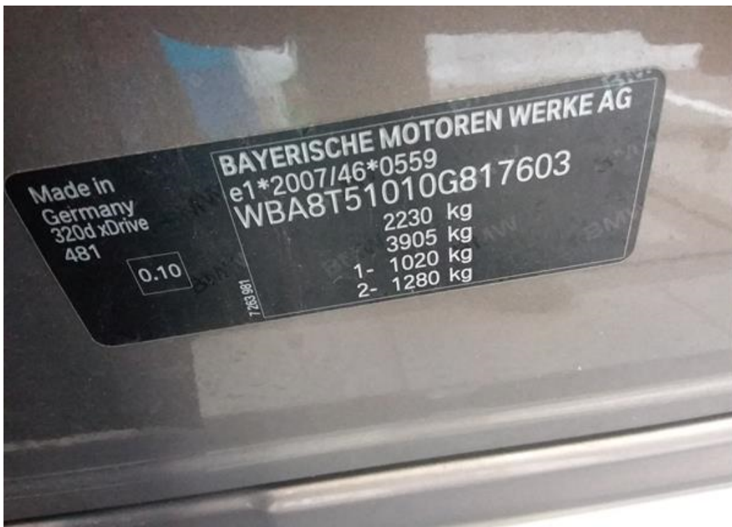
Foto VIN 1