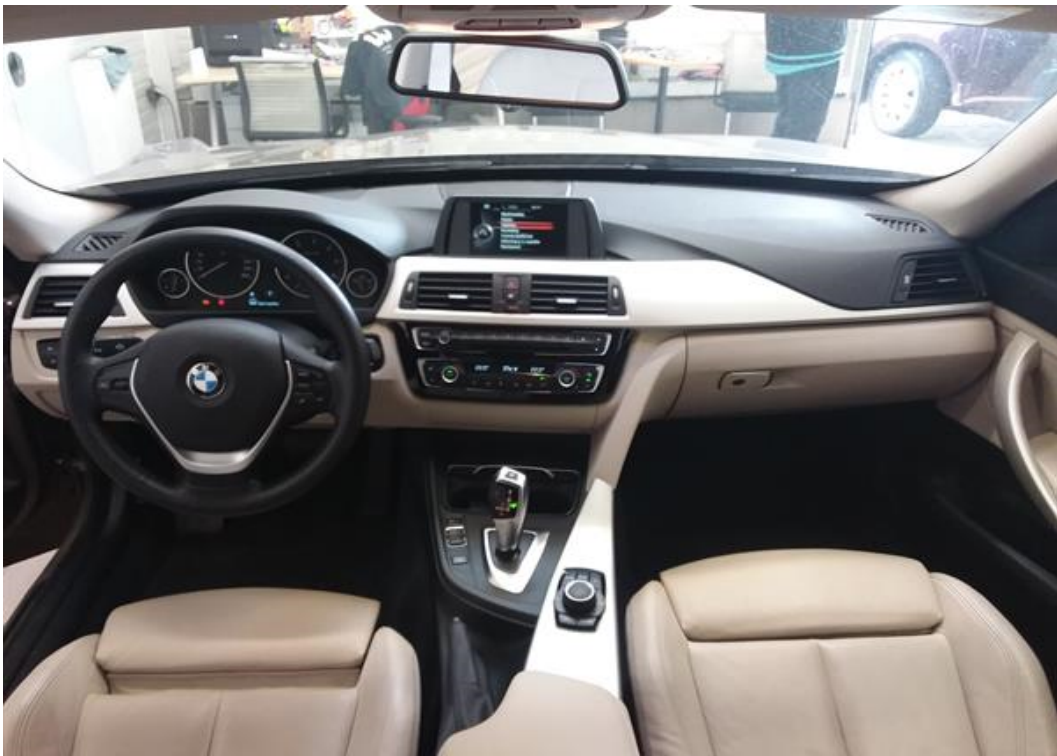
Palubní deska celá