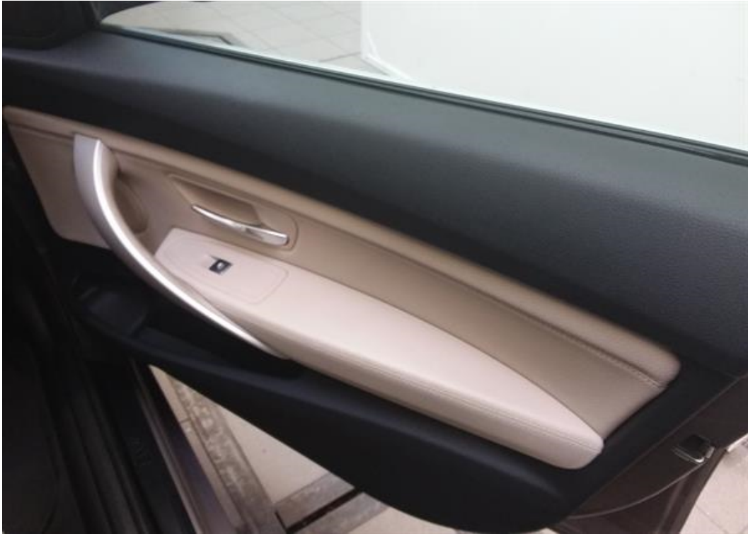
Dveře spolujezdce vnitřní část