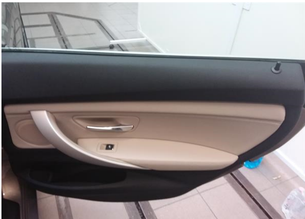
Zadní pravé dveře vnitřní část