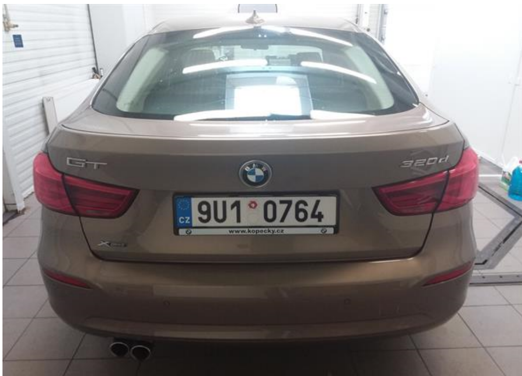
Zadní část vozu