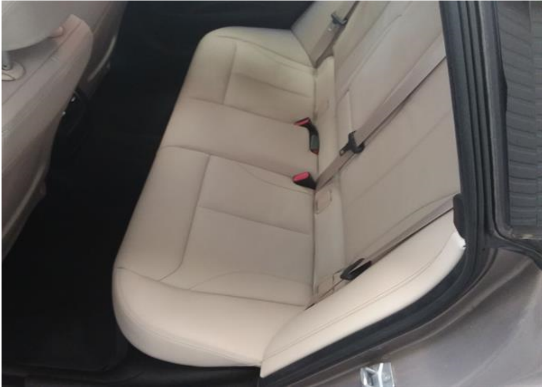
Zadní levé sedadlo