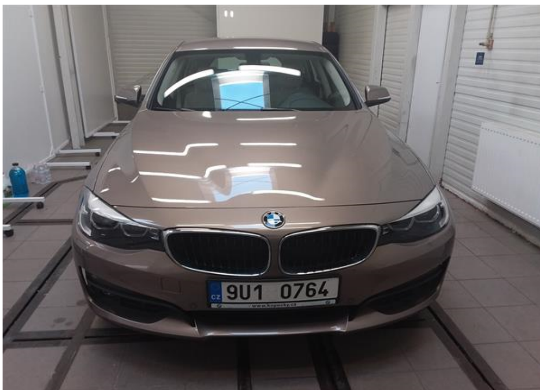
Přední část vozu