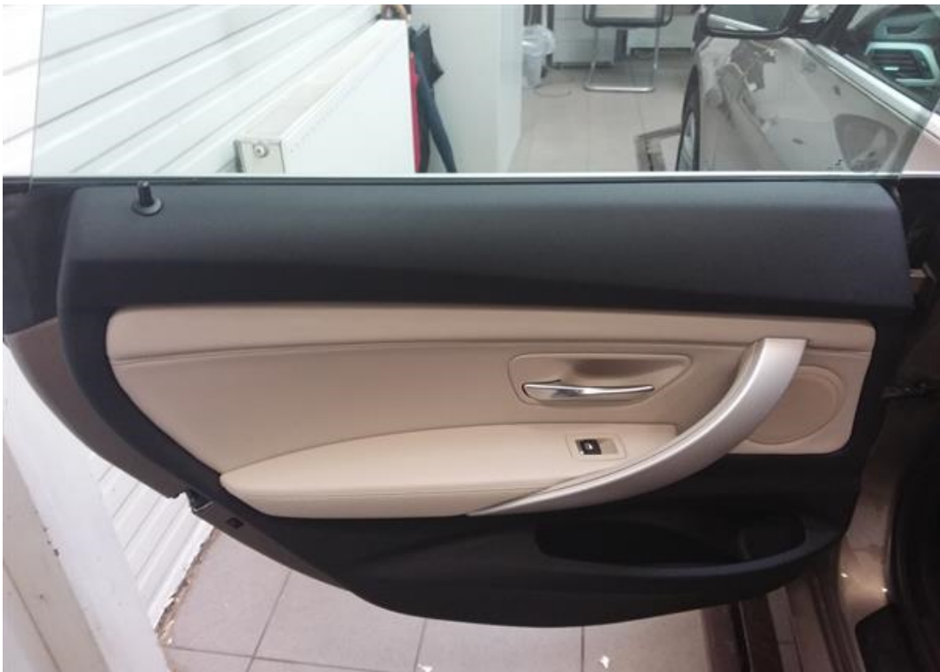
Zadní levé dveře vnitřní část