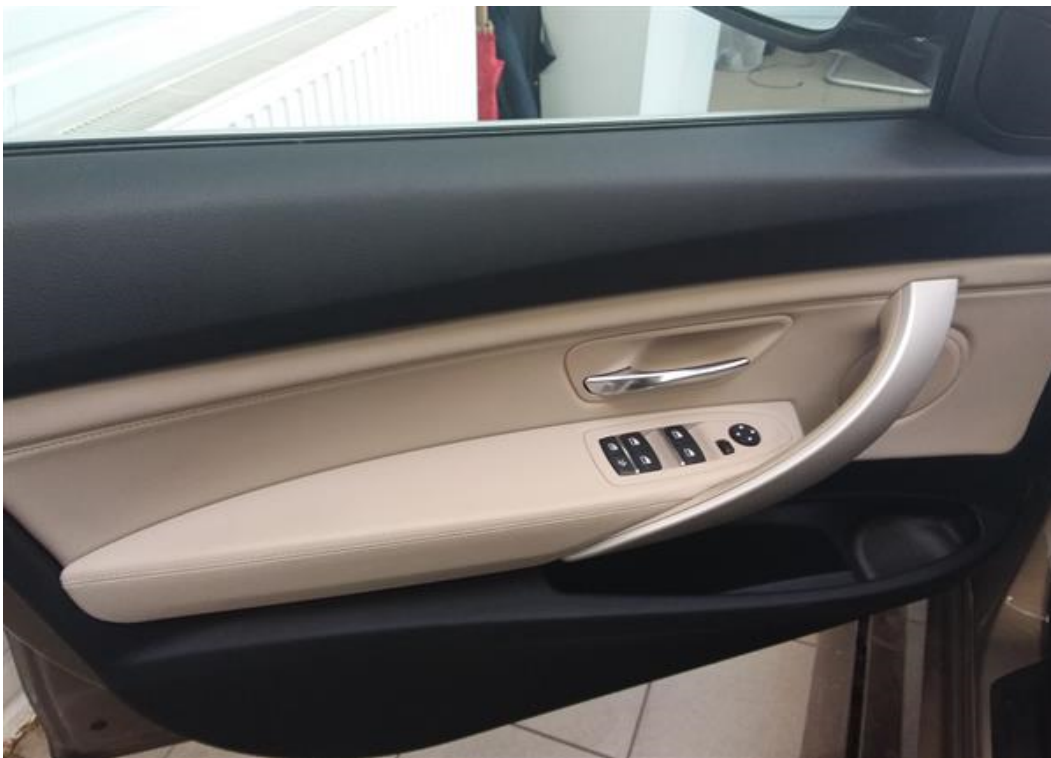
Dveře řidiče vnitřní část