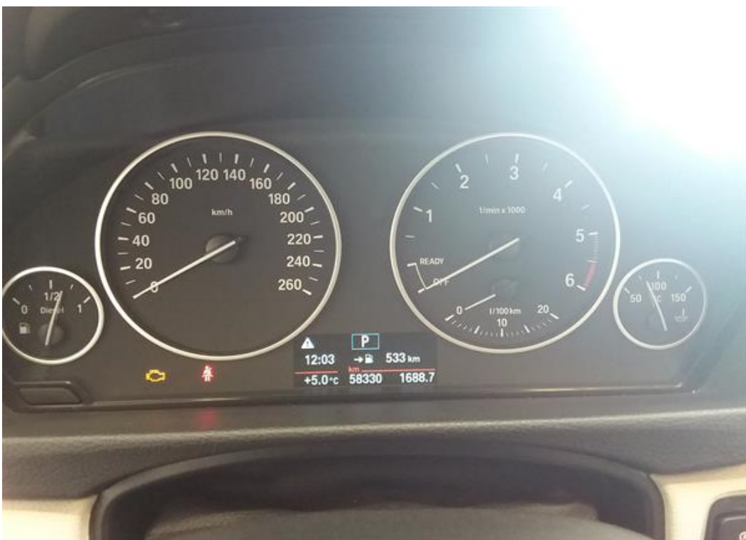
Palubní deska od řidiče