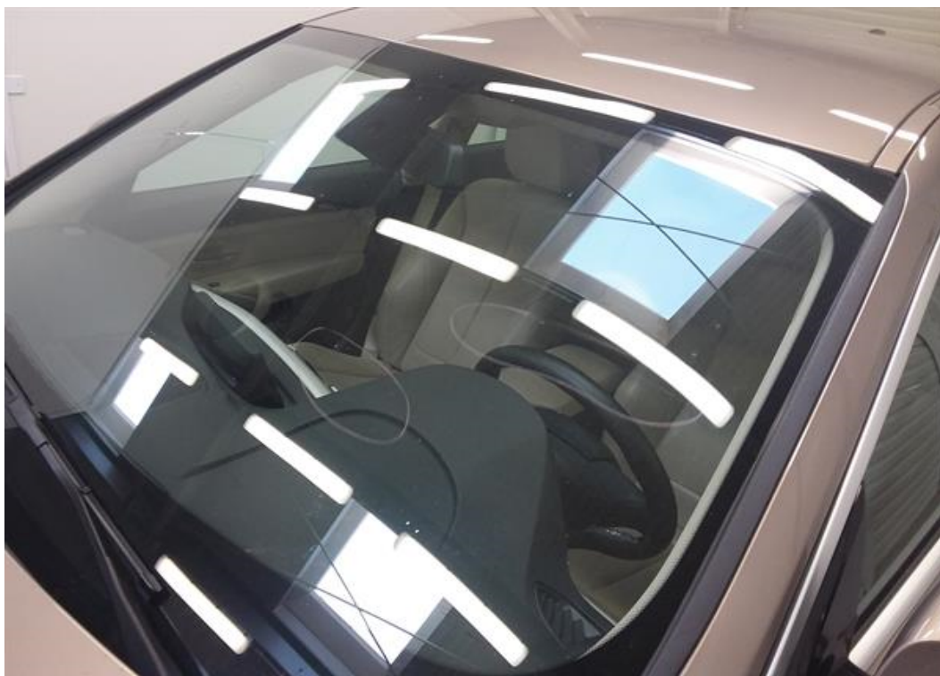
Viz popis k poškození č. 5