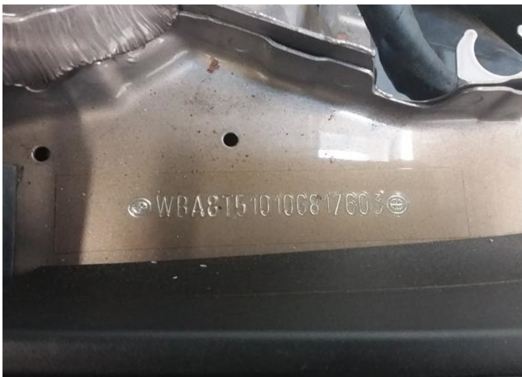
Foto VIN 2