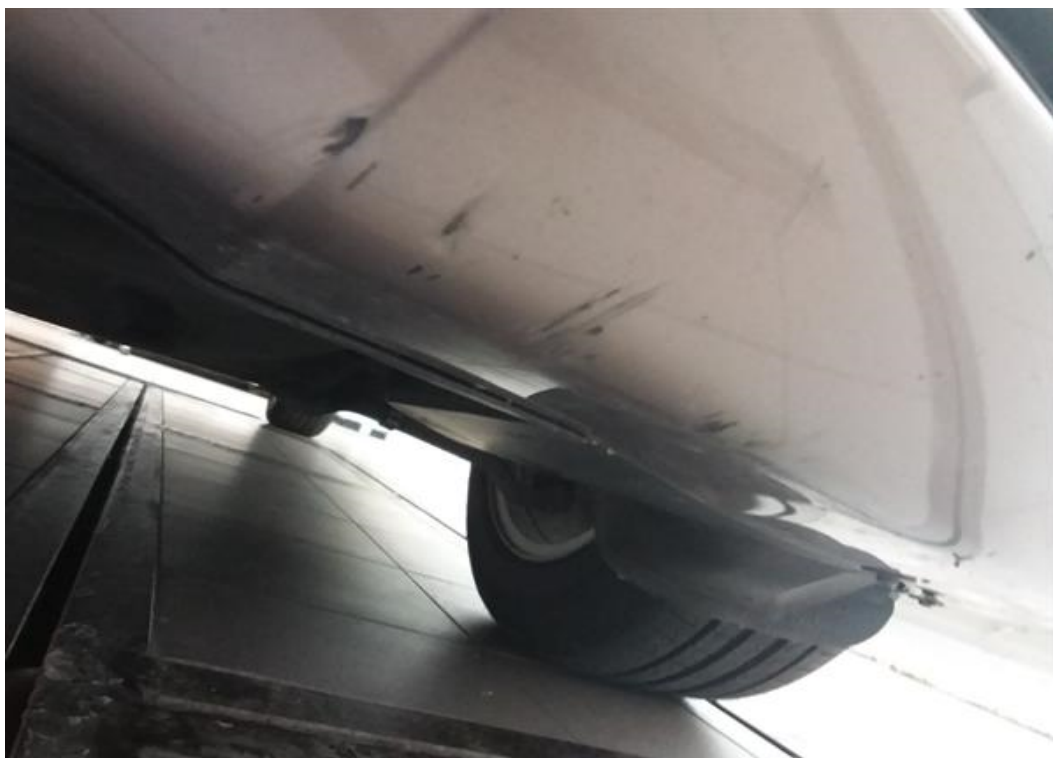
Viz popis k poškození č. 1